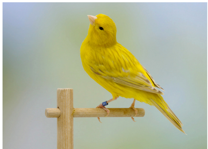
Isabel geel intensief

Natuurlijk niet bij mozaieken, daar moeten de slagpennen zo min mogelijk gekleurd zijn en wordt slechts een zeer lichte nestkleur toegestaan. Bij alle isabellen zijn de hoorndelen vleeskleurig of anders gezegd helder van kleur. Verder worden de isabellen met licht doorschijnende, lichte oogkleur geboren, deze oogkleur wordt snel donker.