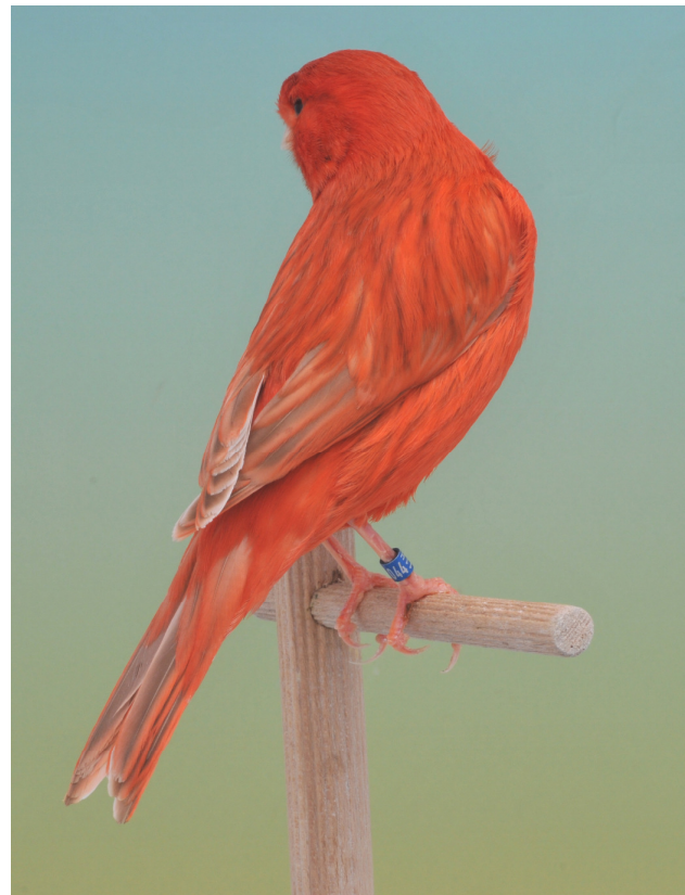
isabel rood intensief

Bij de huidige schimmelvogels moeten we eigenlijk alleen nog mannen tentoonstellen, omdat die beter aan de standaard voldoen dan de poppen, zowel in de gele, rode als in de witte grondkleur. Natuurlijk zijn de mannen met gele en rode grondkleur vaak net iets te intensief van kleur boven de snavel en schouder-topjes maar voldoen ze beter aan een diepe egale grondkleur met fijne schimmelverdeling in combinatie met scherpe afgetekende melanine bestreping. Wel goed letten op het feit dat de melaninstreepjes vanaf de snavelbasis vertrekken.